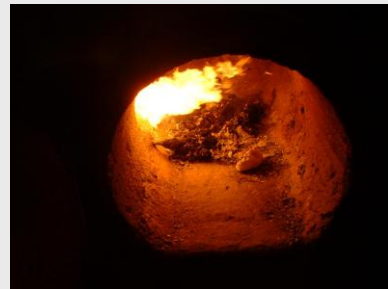
De Perrera van La Linéa