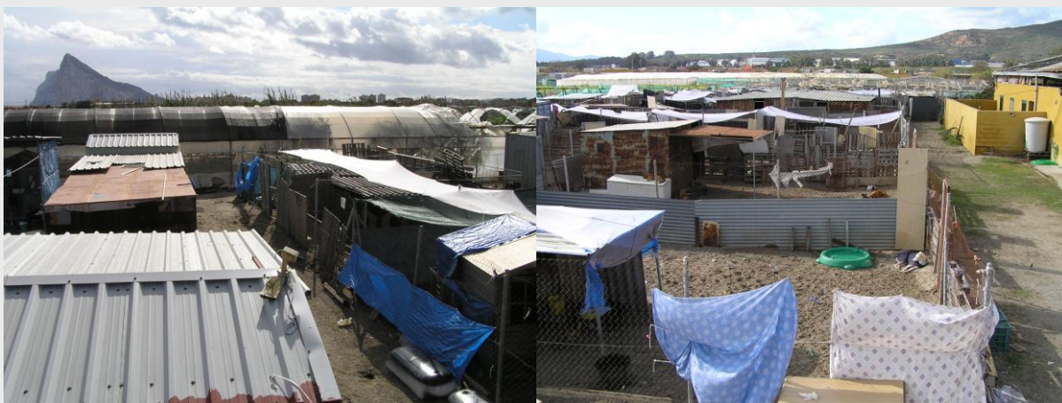
Het asiel anno oktober 2008

Anno 2008 biedt het asiel opvang aan 150 tot 200 honden. De realiteit is echter anders. Vandaag de dag is dit aantal ruim overschreden. Er zijn tal van redenen te noemen. Voor de plaatselijke bevolking is het makkelijker om een afgedankte hond of de puppies af te geven bij het asiel. Dan zijn er de periodes dat er bijzonder veel honden bij de Perrera komen (einde jachtseizoen, dumpen van de honden omdat men op vakantie gaat).