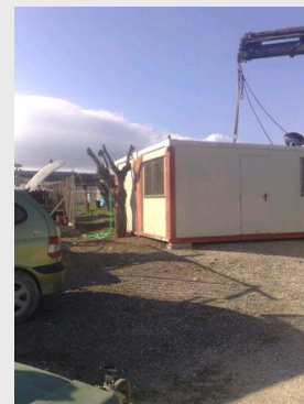
De nieuwe porto cabins waarvan er een als nieuwe kliniek zal worden gebruikt

Onlangs zijn er door sponsoren van twee ondersteunende stichtingen in Nederland (o.a. de Second Chance Foundation Nederland) 4 porto cabins gedoneerd en een volledige inrichting voor een kliniek.