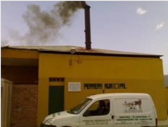
De Perrera van La Linéa